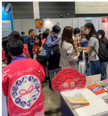
山陰ブース大盛況！