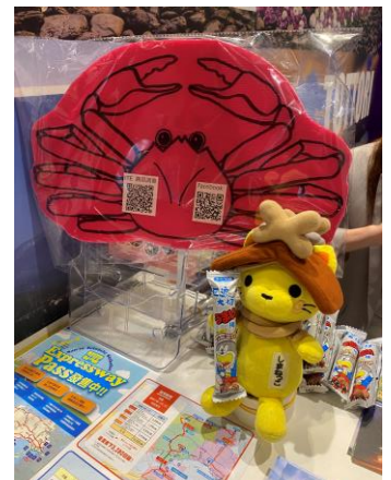
しまねっかもがんばりました