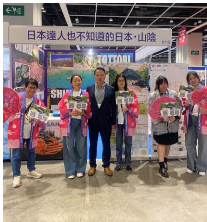
現地スタッフのみなさん

「訪日客は何を求めているのか？」生の声を聞き、今後の山陰のインバウンド誘客に生かしていきます!!