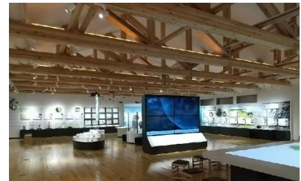
4 月にオープンした隠岐自然館

コロナ禍でインバウンドがストップしている今のうちに、いかに受入環境を整備し、コンテンツを磨き上げていくか、現在はその準備期間だと認識している。本年 4 月には西郷港フェリーターミナルに隣接する形で隠岐自然館がオープンした。フェリーで訪問した方には、まずは自然館に足を運び、隠岐の自然や歴史を理解した上で隠岐ならではのアクティビティーや自然を体験して頂ければと考えている。