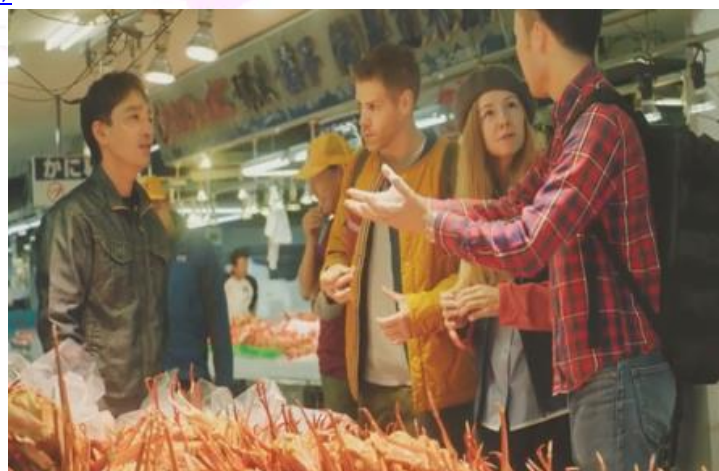
山陰エリア PR 動画