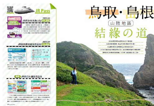
↑ 特集記事イメージ